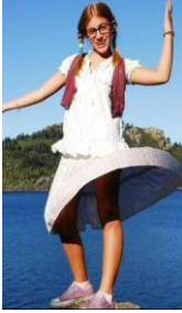
FIGURA 1- PATITO