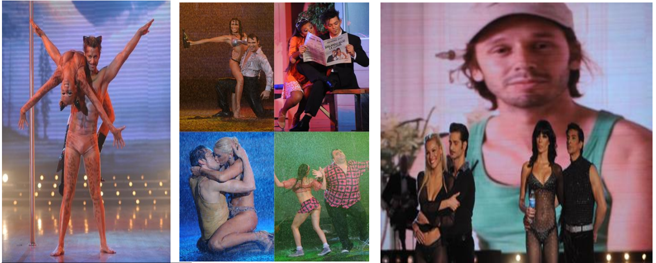
FIGURA 7. Escenas de “Bailando por un sueño”

Las fotografías que aquí se reproducen pertenecen al sitio oficial de Canal 13. Se recomienda el visionado de los videos para una obtener una dimensión integrada, visitando: