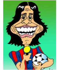
FIGURA 6 - Marcelo Tinelli (caricatura)

Niñas y niños comentan sobre La Tota Santillán, su masculinidad estereotipada desde un cuerpo no hegemónico, niñas y adolescentes se identifican con las participantes femeninas uruguayas, remitiendo a su belleza, a sus valores, centrados en estereotipos de feminidad y de uruguayez .