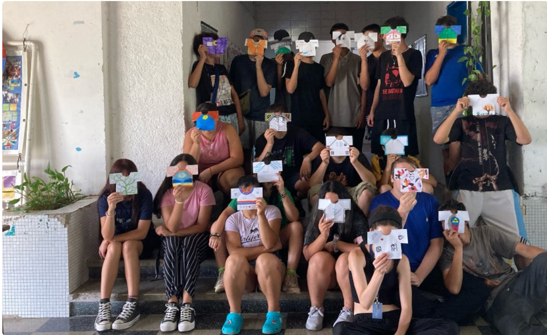
| Grupo ApexAndo, Programa APEX, Udelar. 2024

“mañana puede ser mejor o peor pero tiene que ser distinto” González, C. (2014, p.32)