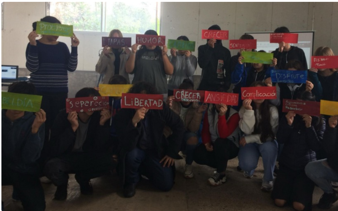
Foto: Adolescentes y jóvenes participantes de la Conferencia “Adolescencias y Juventudes con voz/s” en Bella Unión.

“Las adolescencias y las juventudes siempre fueron «nuevas»; ellos/as son «los nuevos» entre nosotros, como nosotros fuimos los nuevos para los de antes. Son –fuimos– el relevo, el recambio” Kantor, D. “Variaciones para educar adolescentes y jóvenes”