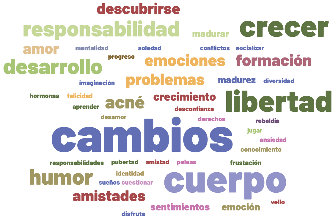
Imágen: Nube creada a partir de las palabras escogidas por adolescentes y jóvenes participantes en la jornada de Bella Unión en relación para referirse a las “adolescencias y juventudes”.

El encuentro fue planificado en formato de taller, mediado por actividades lúdicas y expresivas, con el objetivo de favorecer el diálogo, la discusión y la reflexión crítica. La experiencia práctica-vivencial-lúdica genera y motiva la creación colectiva, propicia el intercambio, así como también favorece la afectividad, la sensibilidad y la expresión de emociones. Pero fundamentalmente ha buscado y estimulado el protagonismo de las adolescencias y juventudes para ser escuchadas, para enunciar y dialogar sobre sus vivencias y sentires.